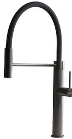
Miscelatore Skin Gun Metal