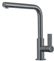
Miscelatore Omega Gun Metal