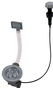
Piletta automatica Gun metal - PG