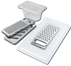
Kit grattugia con supporto per anello e vassoio di raccolta alimenti